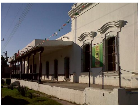
Frente de la propiedad, situada enfrente de la plazuela