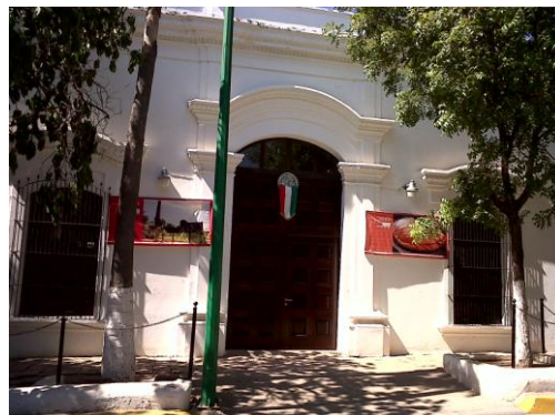
Entrada por el costado derecho.