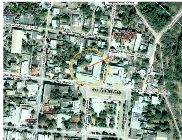
Calle General Francisco Iturbide, esquina, enfrente de La plazuela.